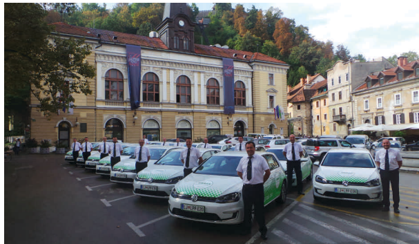
Električna vozila „EURBAN“ in vozniki LPP

EURBAN je nova oblika storitve Prevoza na klic. Osnova storitev poteka na območju Mestne občine Ljubljana. Storitve naročimo preko prometno nadzornega centra LPP po telefonu: 051 240 240 ali 01 58 22 555. Če potnik vstopi v električno vozilo EURBAN v okviru predhodno objavljenih vozniških redov in na postajališčih LPP, plača toliko, kolikor bi plačal za vožnjo z mestnim avtobusom. Tovrstni prevozi so na voljo tam, kjer avtobusi ob določenih dnevih ali urah v dnevu vozijo redkeje. Potnik se mora za tovrstno potovanje prijaviti najmanj dve uri prej.